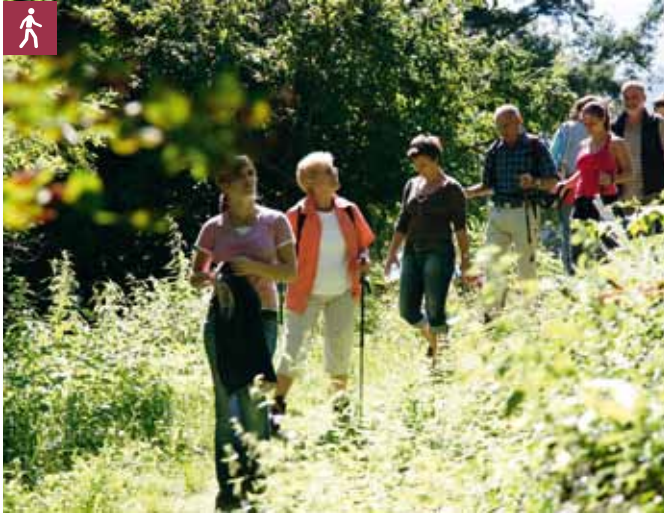
Wanderer Gernsbach

Rundtour mit zahlreichen Aussichtspunkten von Gernsbach zum wildromantischen Naturschauspiel der Laufbachwasserfälle nach Loffenau und zurück nach Gernsbach.