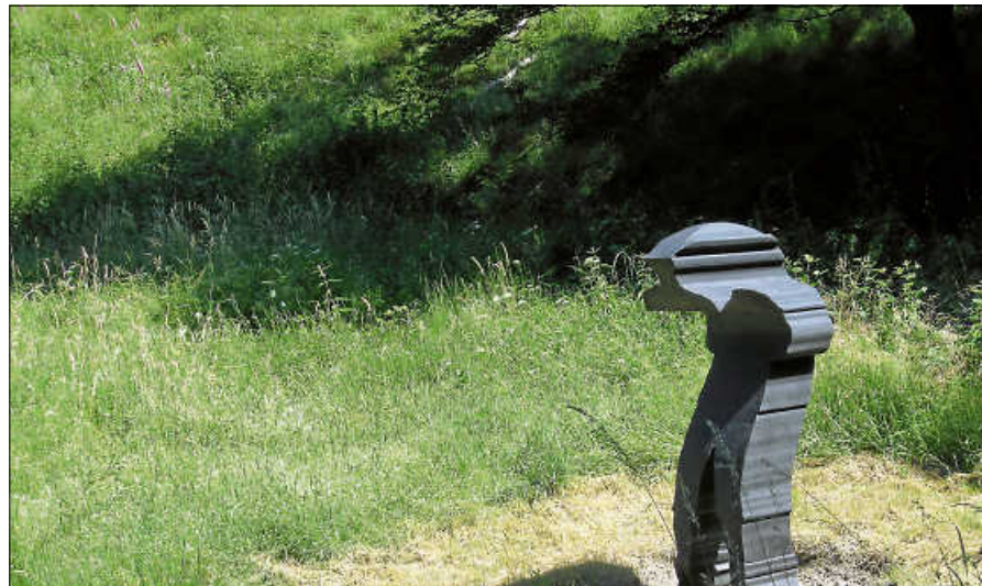
?/tiroler 2022 Beton, Eisen 160 x 54 x 80 cm.

Der Tiroler kann mit seinen exponiertesten Vertretern Andreas Hofer, Louis Trenker und Reinhold Messner als mitteleuropäisches Pendant des guten, naturverbundenen Wilden gelten, welcher seit dem 19. Jahrhundert einen Teil der westlichen Abenteuerliteratur bevölkert. Sein Äußeres mit Kniebundhose, Stock und Hut ist bis heute die Grundausstattung derer, die sich outdoor als Wanderer zu erkennen geben.