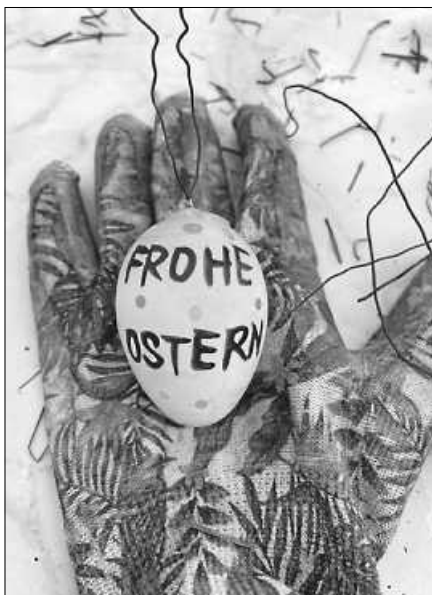
In der Altstadt können Kinder Ostereier bemalen.

In diesem Jahr hat die Süßmostgruppe bereits zum fünften mal die Brunnen geschmückt. Die Tradition, die Altstadtbrunnen mit Girlanden voller bemalter Ostereier zu zieren, wurde bereits 2007 vom Hausfrauenbund Gernsbach ins Leben gerufen und erfreut Altstadtbesucher und -bewohner seither jedes Jahr aufs Neue.