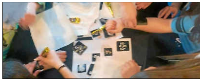
Henna-Tattoos im Schülercafé.

Am 21.04. findet eine CasinoNight 16+ statt. Am 27.04. findet das zweite 'Let's Talk about Ausbildung' in Kooperation mit der Be-