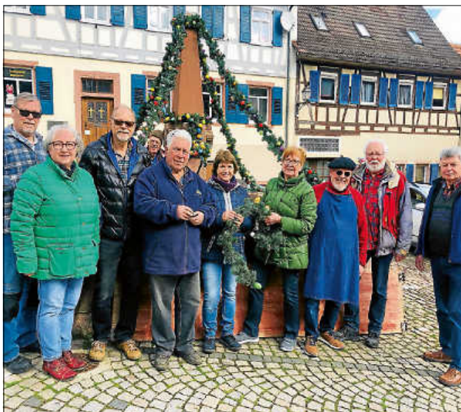
Hofstätte-, Marktplatz-, Metzgerbrunnen sowie der Brunnen in der Oberstadt erhielten dank der Süßmostgruppe wieder ihren bunten Schmuck zu Ostern. Der städtische Bauhof hat die Osterbrunnen Aktion ebenfalls unterstützt.