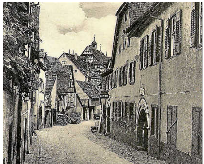
Gasthaus „Badischer Hof“ in der Amtsstraße, Zentrum der Demokraten.

Eine Anmeldung bei der Touristinfo Gernsbach unter 07224 644446 ist erforderlich. Die Tour dauert ca. 2 Stunden und ist kostenlos. ■