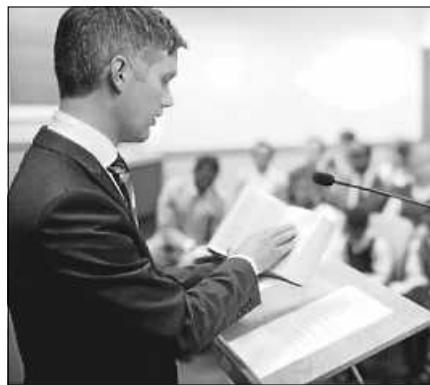
Der Redner erklärt anhand der Bibel, was Jesu Tod möglich macht.

Wer den Hybrid-Gottesdienst übers Internet oder am Telefon mitverfolgen möchte, kann sich unter der Tel.-Nr. 07224 655661 anmelden. Eine Teilnahme ist kostenlos, keine Spenden-sammlungen, etc. Besucher sind immer willkommen.