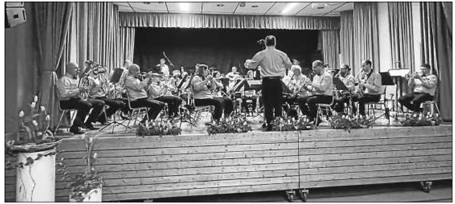
Frühjahrskonzert des Musikvereins Hilpertsau.