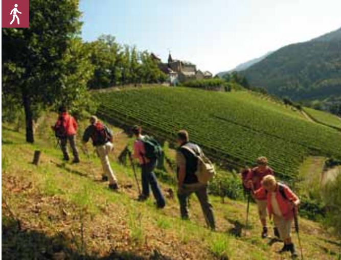
Auf den Spuren der Bergmännle