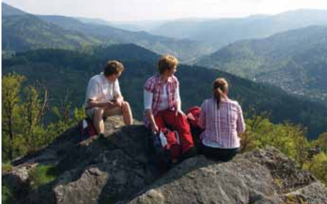
Aussicht Dachsstein

In dieser anspruchsvollen Wandertour wird die Region um die Ortsteile Reichental und Lautenbach erwandert. Entlang des Kunstweges gibt es die typischen Heuhütten zu sehen.