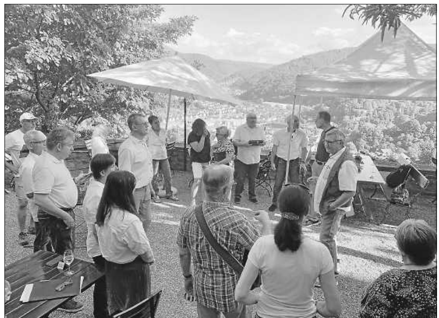
Salt o vocale bei Konzertvorbereitungen auf der Platanenterrasse.