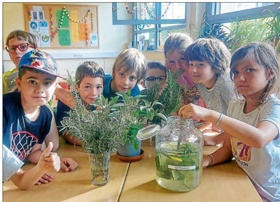
Kinder der 2A mit ihrer selbstgemachten Kräuterlimonade.

durchgezogen und wurde mit dem ebenfalls selbstgemachten Kräuterquark und Brot genossen. Nachdem die Pflanzen noch gemalt wurden, war der schöne Vormittag auch schon vorbei. ■