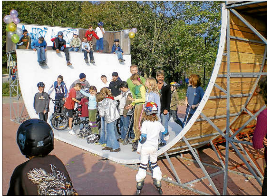
Eröffnung des Skaterplatzes 2007.

Bis Ende Juli läuft zudem noch die Fragebogenaktion zur Neukonzeptionierung.