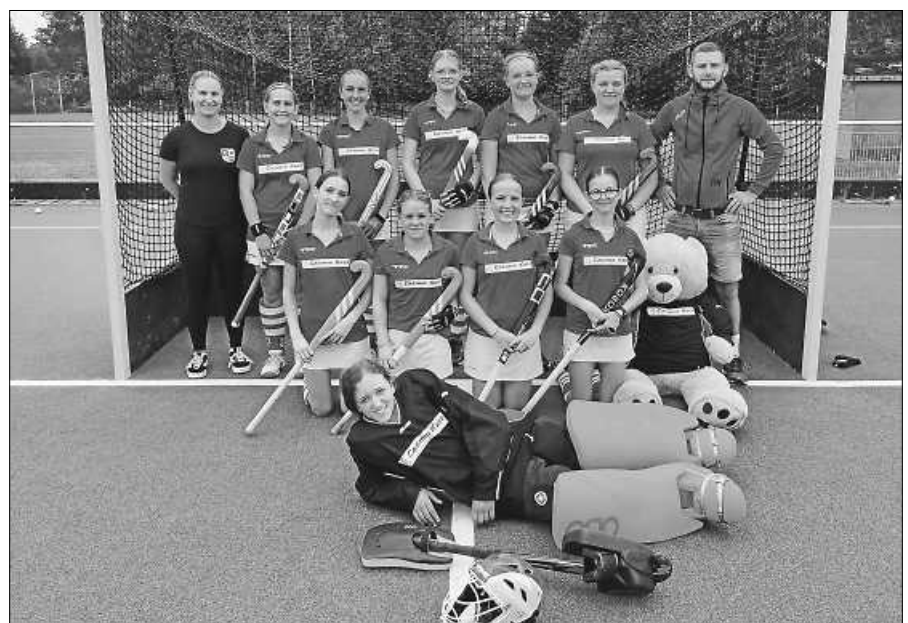
Weibliche U16 in Villingen.