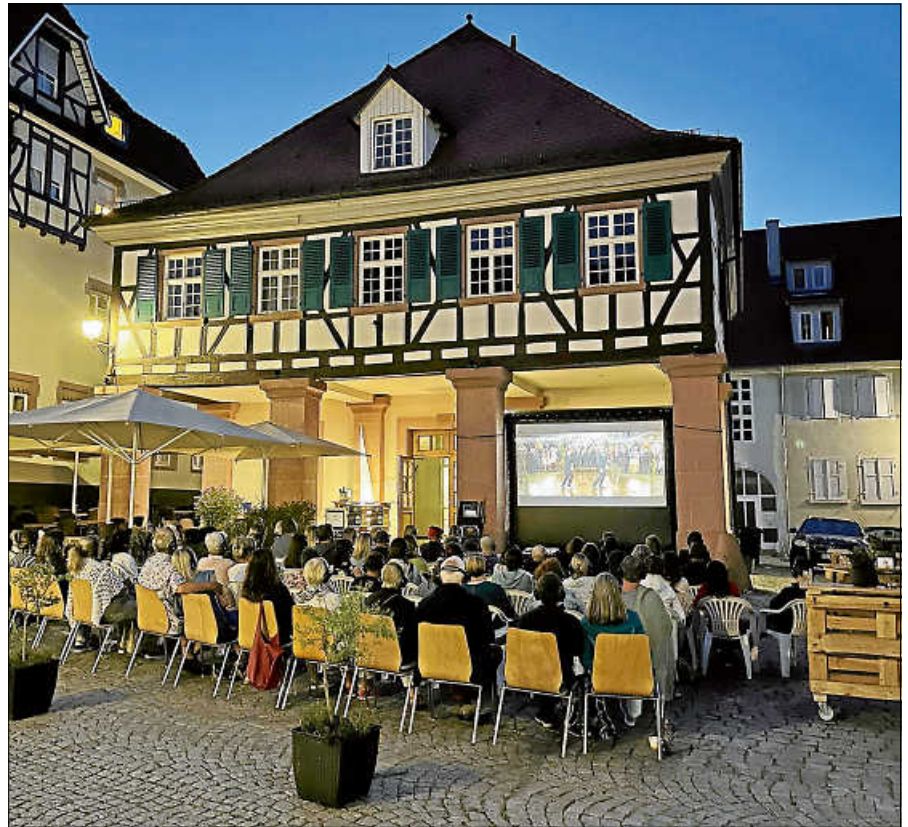
Filmvorführung vor dem Kornhaus.

Bei Regen wird die Veranstaltung unter die Kornhaus-Arkaden verlegt. Bei Unwetter fällt sie aus und der Ticketpreis wird erstattet. Die Veranstaltung ist eine Kooperation des Moviac-Kinos mit dem Kornhaus Gernsbach, Friseur Löwenthal und JØLG. ■