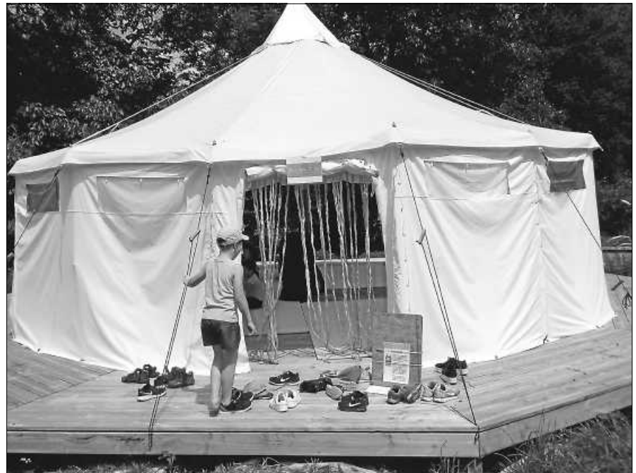
Festival der Achtsamkeit am 22.07.2023 auf dem Weidenhof.