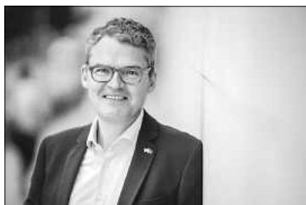
Roderich Kieseewetter kommt.

Die Veranstaltung findet statt am Sonntag, 16. Juli 2023, von 18.00 bis 20.00 Uhr im Unimog-Museum an der B 462, Gaggenau. Die CDU Gernsbach lädt alle Interessierten dazu herzlich ein. Bitte beachten Sie bei Teilnahme die Bitte um Anmeldung bis 10. Juli 2023 bei der CDU-Kreisgeschäftsstelle per E-Mail an anmeldung@cdu-rastatt.de oder telefonisch unter 07222 1577377.