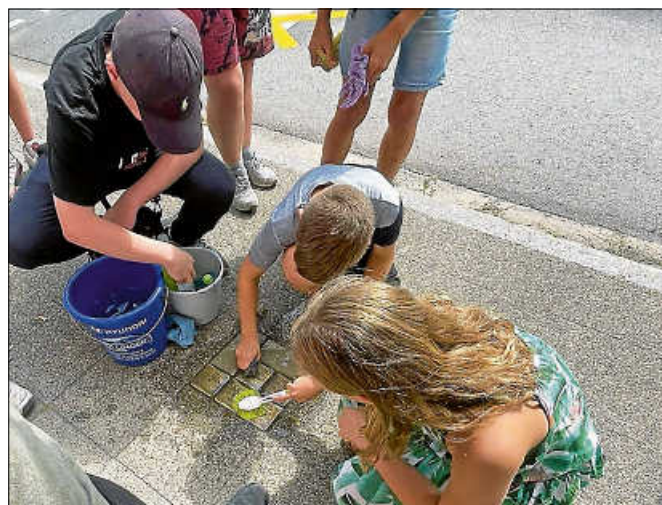
Stolperstein putzen am „Let's talk about Stolpersteine“.