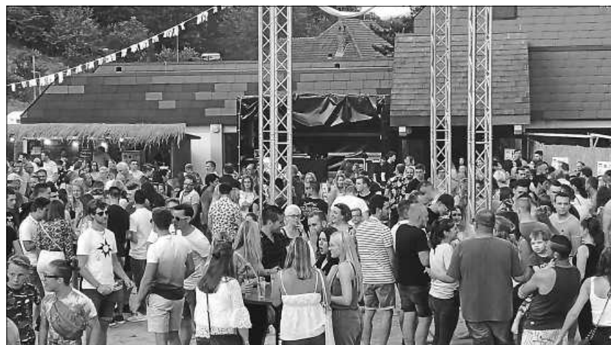
Sommer- und Strandfeeling mit reichlich Sand bei der Beachparty.

Anmeldung erfolgt durch Überweisung auf Konto SV Staufenberg, IBAN: DE56 6655 0070 0060 0112 51. Infos und Kontaktdaten bitte an Klaus Strobel, Handy/WhatsApp 01520 7035651 oder E-Mail KlausStrobel@t-online.de .