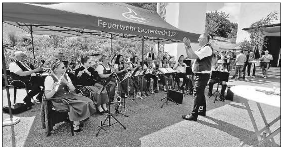
Die Lautenbacher Musikanten beim Platzkonzert vor der Kirche.

mende Festgäste mit ihrem Kurkonzert auf's Beste bis zur Mittagszeit. Für die Festorganisation und die Bewirtung sorgte auf bewährte Weise das Lautenbacher Gemeindeteam.