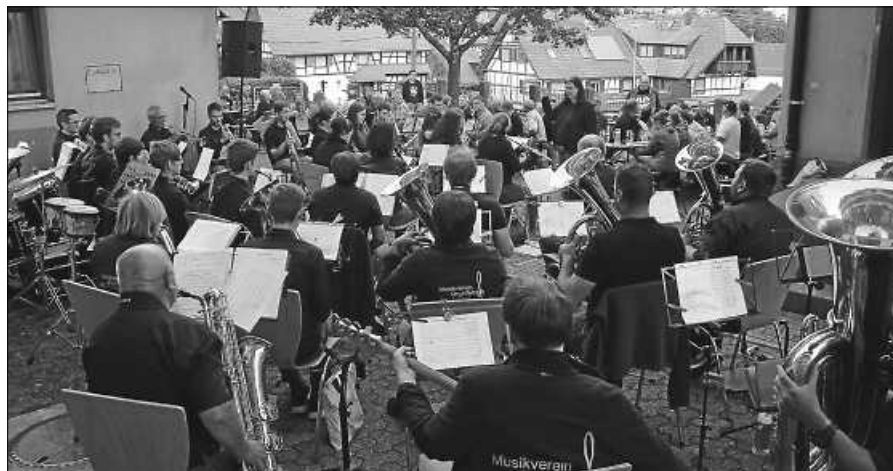
Gute Stimmung beim Feierabendhock.

ins Wochenende heißt es ab 18 Uhr. Die Gemeinschafts-Jugendkapelle und der Musikverein aus Michelbach bilden den musikalischen Rahmen. Bewirtet werden die Gäste mit Leckerem vom Grill. Auch an Vegetarier wird gedacht. Bier vom Fass oder Sommerschorle dürfen nicht fehlen. Falls das Wetter es nicht zulässt, werden wir den Feierabendhock in die Festhalle verlegen. Kommen Sie und feiern Sie mit uns mit Musik ins Wochenende. Auf Ihren Besuch freut sich der Musikverein Orgelfels Reichental. Die weiteren Veranstaltungen und Informationen zum Verein finden Sie unter www.musikverein-reichental.de .