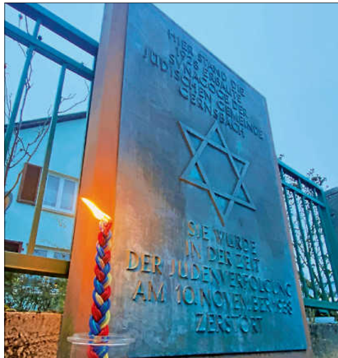
Gedenktafel für die ehemalige Synagoge in der Austraße.

Hinweis: Eine Broschüre zum Sabbatweg Gernsbach ist für 5 € erhältlich bei der Touristinfo Gernsbach. ■