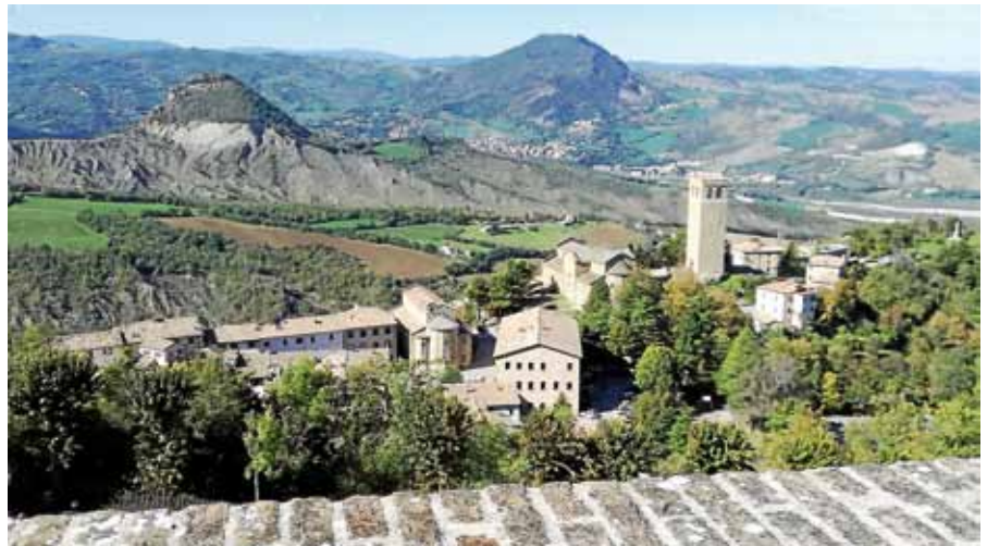
Anmeldungen für die Bürgerfahrt im Oktober sind noch möglich.

Für Gernsbacher Bürger bietet sich mit dieser Reise die Möglichkeit, die idyllisch im Cesano-Tal gelegene und an historischen Sehenswürdigkeiten