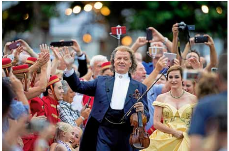
Im Kinocenter Gernsbach ist am Samstag und Sonntag das diesjährige Maastricht-Konzert des Geigers André Rieu zu erleben.

„Amore - My Tribute to Love“ ist eine Hommage des berühmten Violinisten an seine Liebe zur Musik und zu seinen beiden Familien: seiner Frau und den Kindern und seinem Johann-Strauss-Orchester, welches erst 2017 sein 30-jähriges Bestehen feierte. Das Kinoevent folgt der Veröffentlichung