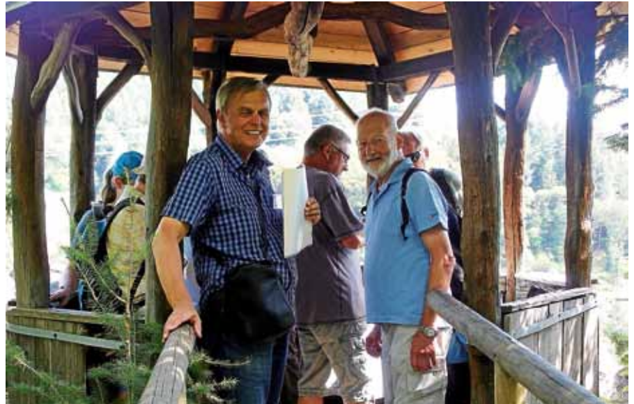
Bei der kostenlosen Führung erleben Kinder und Erwachsene den Zauber einer wunderbaren Sagenwelt.