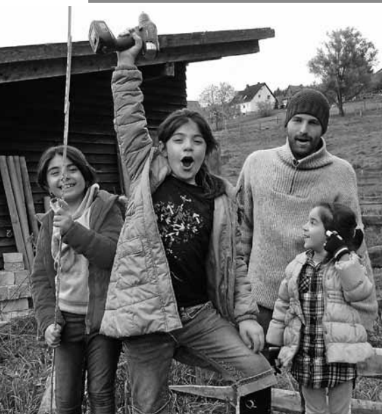
Ein vielfältiges Angebot gibt es für die Kinder. Foto: Pferde bewegen Menschen