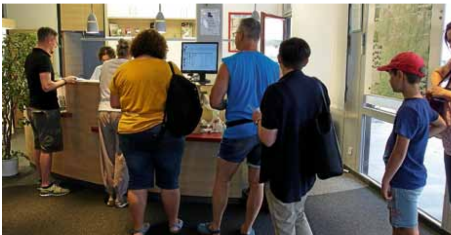
Die Damen der Touristinfo hatten am Erstausbabetag alle Hände voll zu tun.

„Schwimmbadübernachtung im Igelbachbad“ (nur noch wenige Karten). Die DLRG Jugend Gernsbach lädt dich zu einer gemeinsamen Übernachtung im Igelbachbad Gernsbach ein. Den Abend verbringen wir mit Spielen im und am Wasser und einem gemütlichen Grillen. Nach einem gemeinsamen Abbau am nächsten Morgen werden wir uns mit einem Abschlussfrühstück stärken. ☐