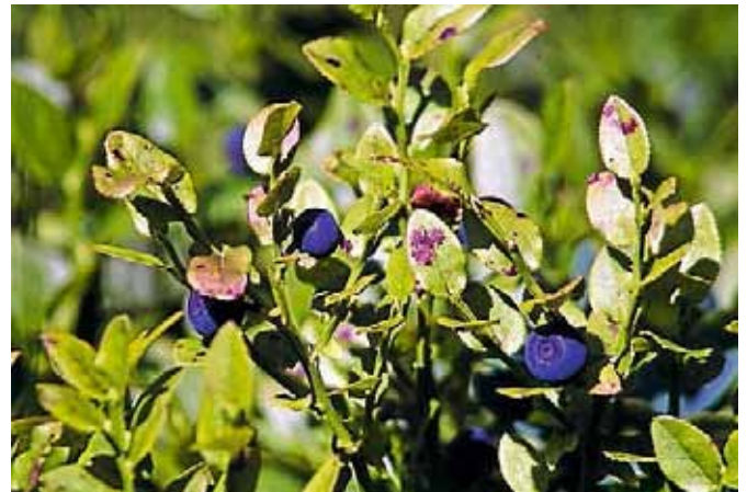
Beim Spaziergang gibt es Kostproben und Geschichten über die Heidelbeere.

Schon beim Wandern und Beeren sammeln tut man seiner Gesundheit etwas Gutes. Wenn man dann noch erfährt, welches kleine Kraftpaket Heidelbeeren sind und feststellt wie lecker sie schmecken ... eine perfekte Kombination. Wo haben sich die kleinen blauen Kugeln versteckt? Auf der kleinen Wanderung gibt es Kostproben, Wissenswertes und Geschichten rund um die süßen Leckereien. Aus den selbst gesammelten Heidelbeeren wird gemeinsam eine köstliche Erinnerung für zu Hause gekocht. Die Veranstaltung ist für die ganze Familie geeignet. Bitte kleines Gefäß zum Sammeln mitbringen. Anmeldung unter Telefon 655197, Dauer circa drei Stunden, Kosten 5 Euro pro Person, Kinder unter 10 Jahren sind frei. □