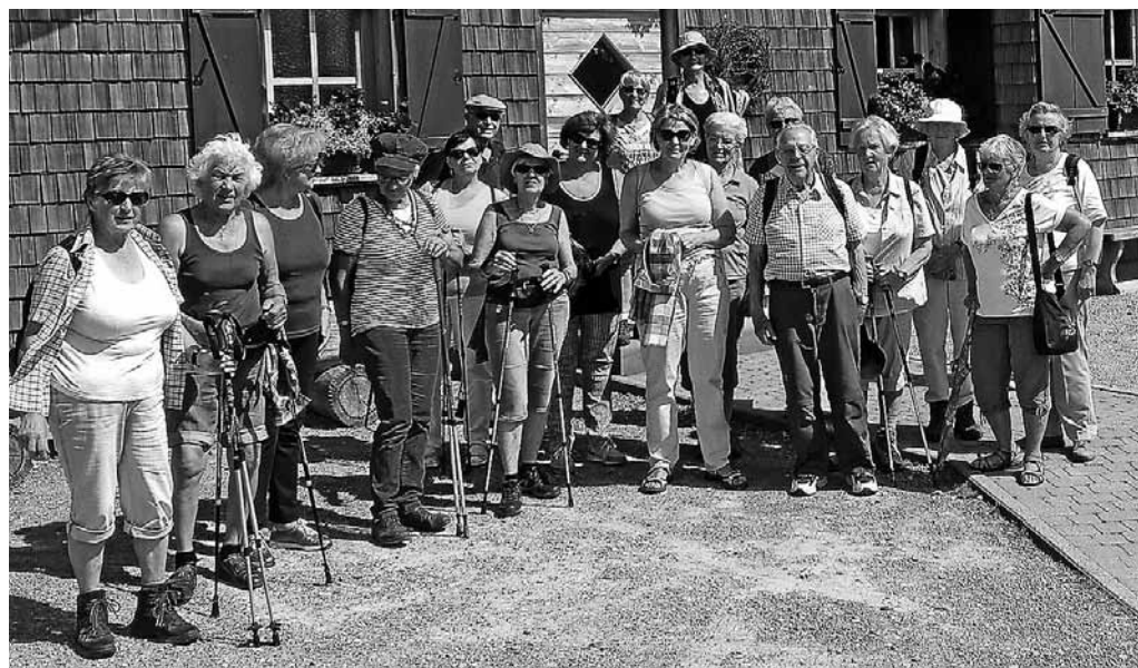
Unterwegs nach Schönmünzach.