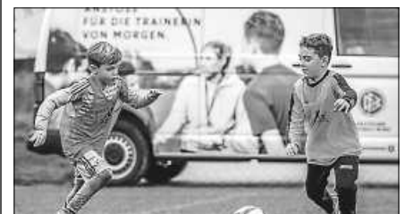
DFB-Mobil beim SV Staufenberg.

Am Freitag, 28.10., um 17 Uhr gastiert das DFB-Mobil bei uns auf dem Sportgelände. Das DFB-Mobil kann von jedem Verein einmal im Jahr gebucht werden. Zwei lizenzierte Teamer kommen zum Vereinstraining und zeigen den Vereinstrainern, neue und zeitgemäße Trainingsmethoden für den Kinder- und Jugendbereich auf. Im Anschluss an das Training kommt es mit den Vereinstrainern zu einem Trainergespräch, bei dem das Training aufgearbeitet wird und weiter Themen diskutiert werden.