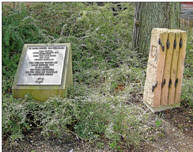
Gedenksteine am Nepomukplatz.

mitgestalten. Zum Abschluss wird Bürgermeister Julian Christ die Namen der Deportierten verlesen, und mit dem Anzünden der Kerzen wird die Veranstaltung an den Gedenksteinen am Nepomukplatz enden. ■