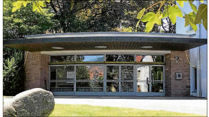
Stadthallenvorplatz wird nach der einzigen Ehrenbürgerin der Stadt benannt.