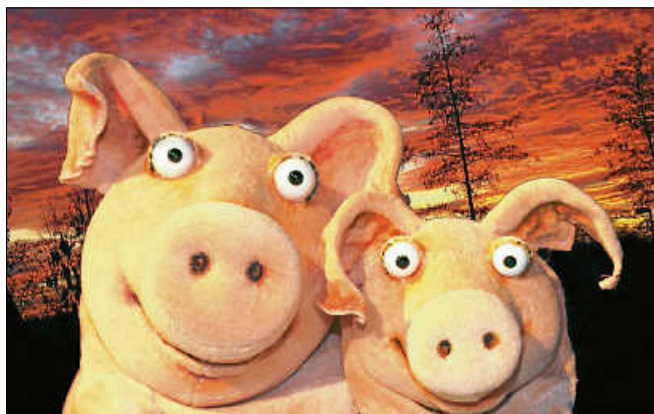
„Piggeldy und Frederick“.

Sonntag, 22. Januar 2023, 15 Uhr: Tomte Tummetott (Figurentheater Unterwegs)