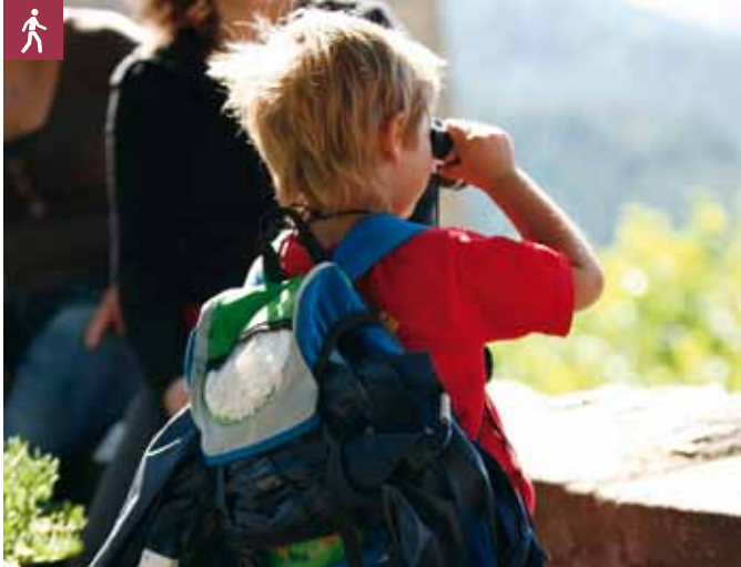
Wanderbub bei Schloss Eberstein