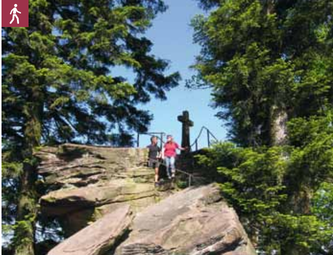
Gipfelkreuz am Bernsteinfels

Wanderung zum Bernsteinfels mit schöner Aussicht auf das vordere Murgtal und das Albtal. Zurück über das Fachwerkdorf Loffenau in den malerischen Ort Gernsbach.