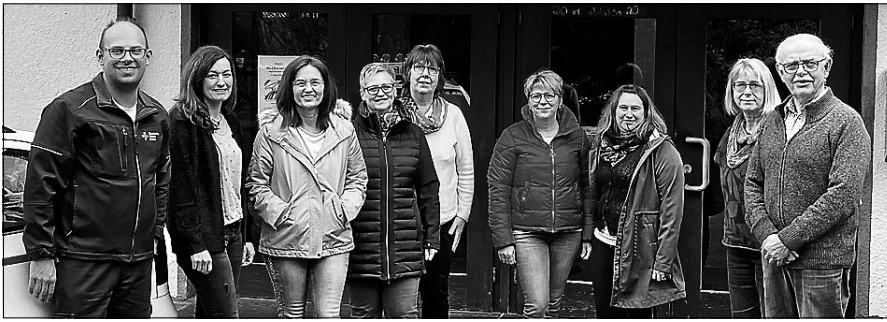
Erste Hilfe Workshop beim TVL.