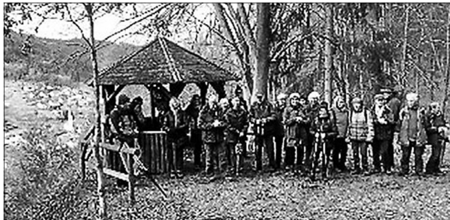
Die Mittwochswanderer unterwegs.

Der Schachklub Gernsbach musste in der 7. Spielrunde des Schachbezirks