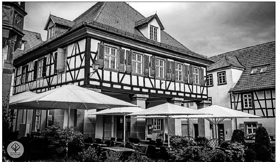
Das Kornhaus in der Gernsbacher Altstadt heißt euch zum Tag der offenen Tür willkommen!

Was passiert da eigentlich - im Kornhaus? Was ist überhaupt CoWorking? Du möchtest einmal genauer wissen, was bei uns geschieht? Gern zeigen und erklären wir dir alles! Wir öffnen am Samstag, 21.3., Unsere Türen! Hier kannst du dir alles einmal genau anschauen und uns gern bei der Gelegenheit Löcher in den Bauch fragen. Schau herein, im völlig neu gestalteten Kornhaus auf dem Gernsbacher Altstadtbuckel. Wirf exklusiv einen Blick in die Räumlichkeiten im ersten Stock. Schau dir den CoWorking Space mit seinen Arbeitsplätzen sowie die modern gestalteten Meeting Räume an. Informiere