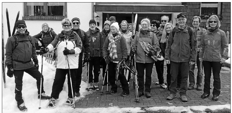
Sportliches Schneevergnügen der Naturfreunde Gaggenau-Gernsbach.

Am Freitag, 28.02.2020, machten sich 20 NaturFreunde auf den Weg zu ihrem jährlichen Winterwochenende. Übernachtet wurde im 1150 m hochgelegenen Naturfreundehaus Brend bei Furtwangen. Die Wettervorhersagen waren schauderhaft. Von Regen bis nächtlichen Orkan-Böen im Südschwarzwald wurde in den verschiedenen Wetter-Apps