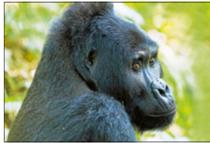
Berggorilla in Uganda.