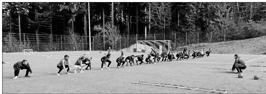
Fitnessübungen für einen erfolgreichen Start in die Restrunde.

Alle Ergebnisse der Vorbereitungsspiele: 3 Siege - 2 Niederlagen - 1 Unentschieden; 4.3. SVS - Würmersheim 11:3; 29.2. SVS - Weisenbach 7:1; 15.2. SVS - Bruchhausen 4:6; 12.2. SVS - RW Elchesheim