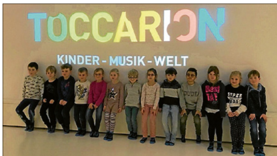
Musik zum Anfassen erlebten die Kinder im "Toccarion in Baden-Baden

Im nächsten Raum, in dem Stimmmodelle zu sehen sind, konnten die Kinder anschaulich miterleben, wie die menschliche Atmung funktioniert und wie es dazu kommt, dass Töne aus unserem Mund kommen. Mit Interesse betrachteten die kleinen Besucherinnen und Besucher den Laserpult, der Geräusche erkennen, speichern und wiedergeben kann. Im Fürstenzimmer lernten die