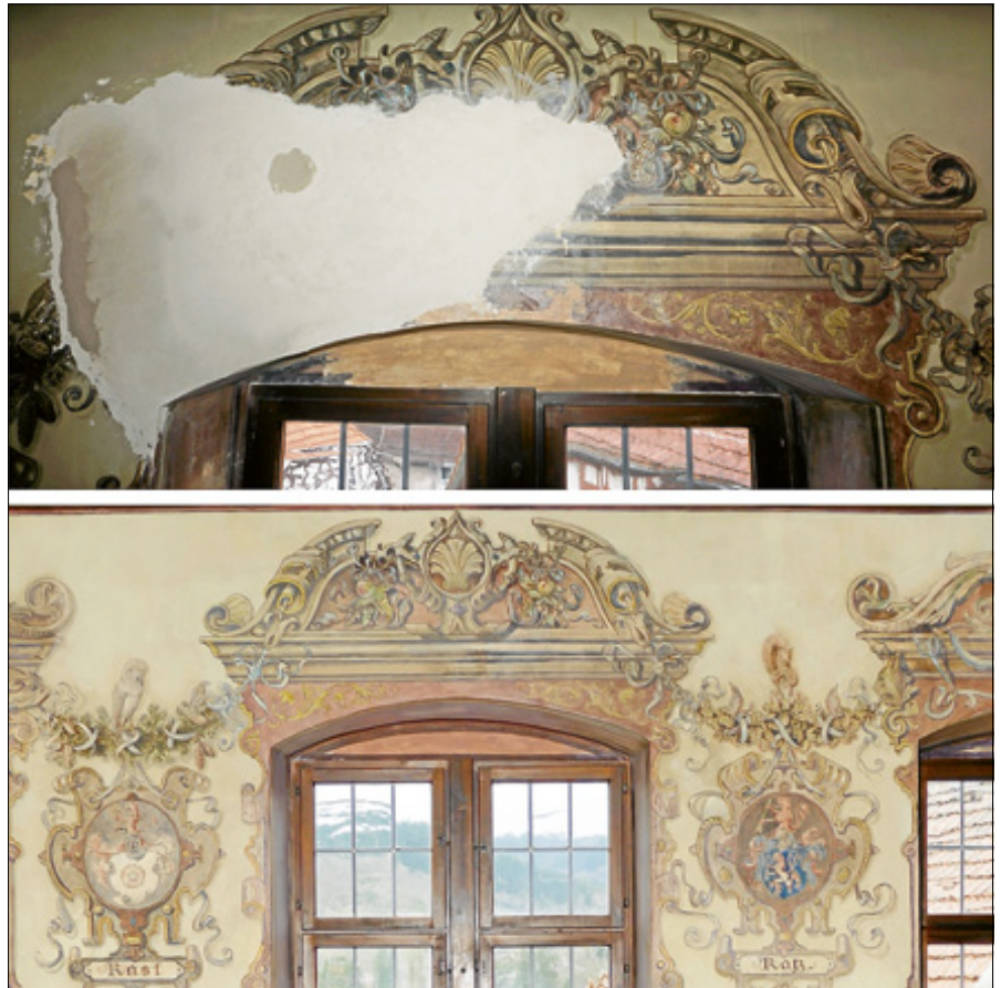
Die große Fehlstelle vor und nach der Restaurierung

Mithilfe von Pauspapier bildete er die Umrisse und Binnenzeichnungen auf der Wand ab. Zur Bemalung in den Farben der Originalvorlagen setzte er hochwertige Acrylfarben ein, die der ergänzenden Malerei als Bindemittel