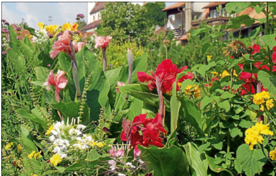
Wilde Blumen am Wegesrand