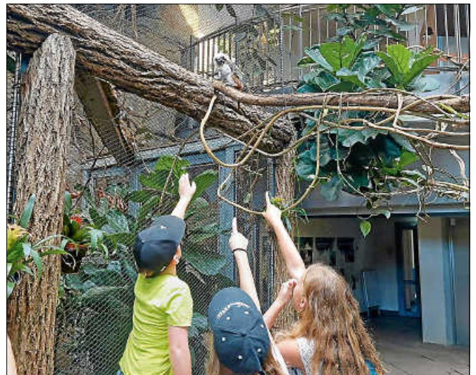
Ausflug in den Zoo Karlsruhe (Ferienprogramm)

Weitere Informationen über Angebote und Events findet man bei Instagram unter @jugendhaus_gernsbach und auf der Facebookseite. Das Jugendhaus-Team ■