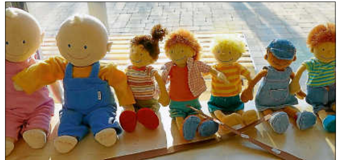
Alle Erlöse kommen den Kindern des Fliegenpilzes zugute.

Für Kaffee und Kuchen, heiße Wurst und Getränke ist gesorgt. Für die Kinder wird ein Tisch mit Material zum Malen vorbereitet. Verkauf findet von 14.00 Uhr bis 16.00 Uhr statt. Aufbau für die Verkäufer ab 13.00 Uhr. Ab sofort können Tische unter folgender Telefonnummer 07224 6996400 in der Kita Fliegenpilz zu den üblichen Kita-Zeiten reserviert werden. Der Unkostenbeitrag pro Tisch beträgt 10 € oder 5 € und einen Kuchen. Der erwirtschaftete Geldbetrag wird in vollem Umfang für die Kita-Kinder eingesetzt. ■