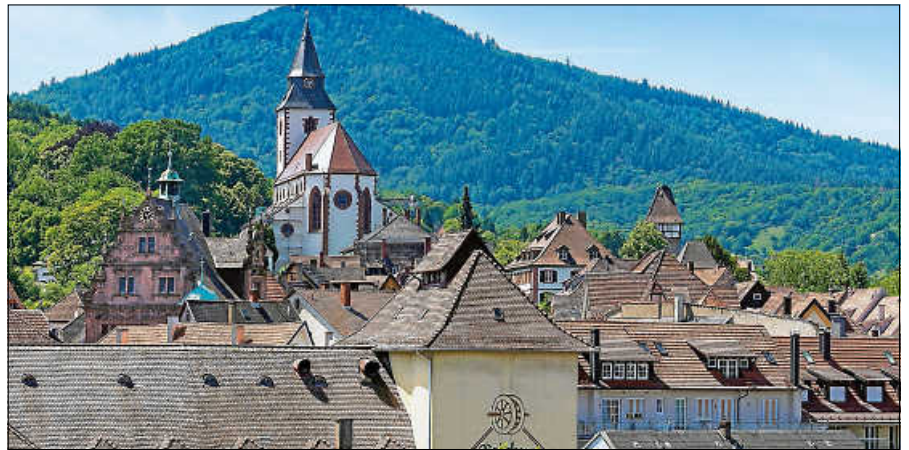
Blick über die Dächer der charmanten Altstadt von Gernsbach.

Altstadtentwicklungskonzept finden Sie unter: www.gernsbach.de/altstadt . ■