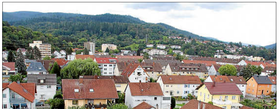
Blick auf die Kernstadt.

Beim Gernsbacher Format „Rathaus vor Ort“ gehen Bürgermeister Christ und die Amtsleitungen des Rathauses direkt mit den Bürgerinnen und Bürgern in den Ortsteilen ins Gespräch, beantworten Fragen und nehmen Ideen auf. Kommen Sie vorbei! Reden Sie mit! Ihre Meinung zählt! ■