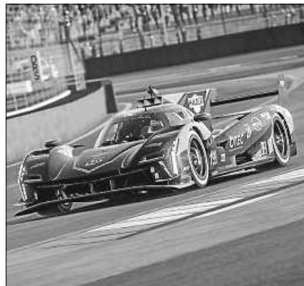
Podestplatz 3 und 5 für Halder eSports

Das nächste Rennen der EWC findet am 21.10.23 auf dem Twin Ring Motegi und über eine Distanz von 12 Stunden statt.