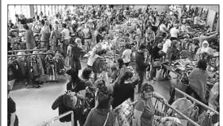
Großer Andrang beim KidsBazar.

Weitere Informationen finden Sie auch unter: www.treffpunkt-staufenberg.de . Haben Sie Fragen, schicken Sie uns eine E-Mail an: kids-bazar.staufenberg@web.de