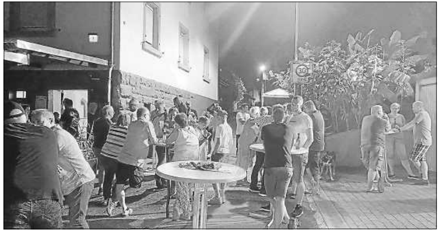
Gute Atmosphäre beim Dorfhook.

Am vergangenen Samstag fand bei schönstem Wetter der Dorfhook am Sternenplatz in Scheuern statt. Der Einladung des Scheuerner Fasnachtsclubs zu einem ungezwungenen Miteinander sind viele Bürgerinnen und Bürger gefolgt, durften in gemütlicher Atmosphäre Leckereien vom Grill genießen und das ein oder andere Kaltgetränk zu sich nehmen. Die nächste Veranstaltung ist dann wieder Weihnachten am Sternen.