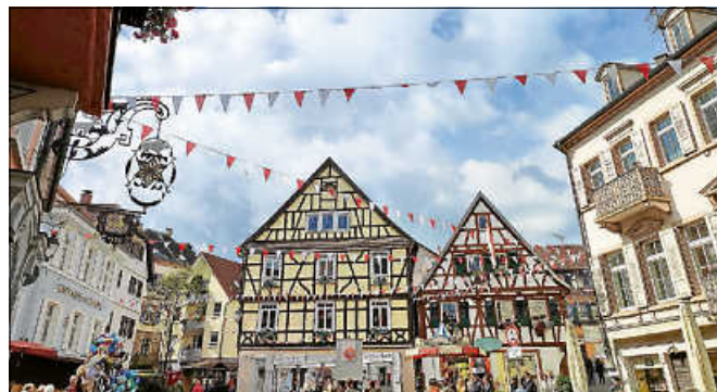
Im September lockt das Altstadtfest Gernsbach mit tollen Angeboten.

Die bequemste Fahrt zum Gernsbacher Altstadtfest haben Sie mit der Stadtbahn. Damit die Gäste frei von Parkplatz- oder Promillesorgen anreisen können, nehmen Sie die S8, RE 40 oder RB 41 zum Fest. Der Eilzug RE 40 wird am Festwochenende während der Festzeiten auch in Gernsbach Mitte halten. Außerdem werden die Stadtbahnen S8 mit zusätzlichen Wagen verstärkt, das Land Baden-Württemberg hat sich bereit erklärt, die Kosten