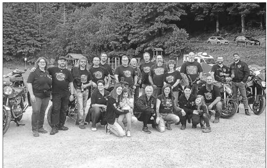
Motorradtreffen MC Gausbach.

Für ein allerletztes Treffen geht es allerdings am letzten Septemberwochenende noch einmal nach Falken zum Saisonabschluss der befreundeten Bad Skulls.