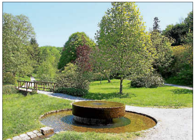
Der Gernsbacher Kurpark.

Treffpunkt ist am Sonntag, 17. September, um 10.05 Uhr an der Tourist-Info Gernsbach. Die Tour ist kostenfrei und dauert ca. 2,5 - 3 Stunden. Eine Anmeldung bei der Touristinfo Gernsbach unter 07224 644446 ist erforderlich. ■