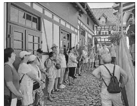
Viele Interessierte waren bei der Ortsbegehung dabei.