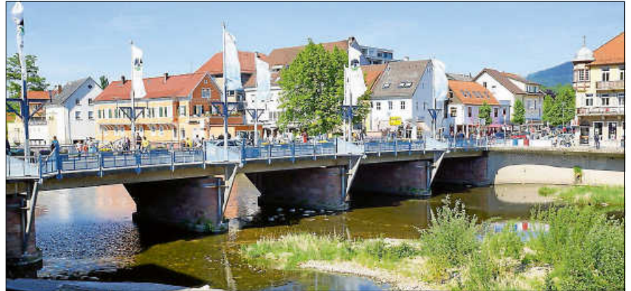
Verkaufsoffener Sonntag rechts und links der Murg.

Die Atmosphäre des gleichzeitig stattfindenden Altstadtfestes bietet einen optimalen Rahmen, um sich von den Angeboten der örtlichen Händlerinnen und Händler und der vielseitigen Gastronomie inspirieren zu lassen. Buy local: Die Unterstützung der lokalen Wirtschaft trägt zur Förderung der Nachhaltigkeit bei. ■