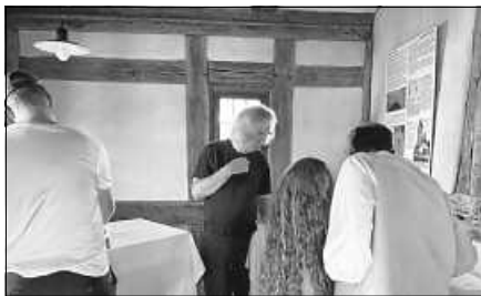
Intensives Interesse an den Geldscheinen aus den 1920er-Jahren in der Turmstube des Storchenturmes.

Am Tag des offenen Denkmals ließen es sich einige Interessierte nicht nehmen, trotz der hohen Temperaturen die Stufen im Storchenturm bis in die Turmstube zu erklimmen. Dort wurden 100 Jahre alte Geldscheine aus den Beständen des Gernsbacher Stadtarchivs präsentiert. Zum Teil wurde das Inflationsgeld aus den Jahren 1922 und 1923 mit Gernsbacher Motiven verziert. Diese Raritäten fanden großes Interesse und wurden intensiv betrachtet.