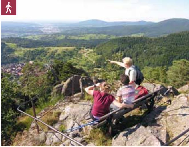
Aussicht Lautenfelsen

Wanderung zu einem der schönsten Aussichtspunkte in Gernsbach, dem Lautenfelsen (Naturschutzgebiet), der sich geradezu majestätisch über dem Ortsteil Lautenbach erhebt.